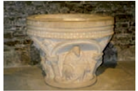
Foto: Pica Baptismal del Monestir de Ripoll