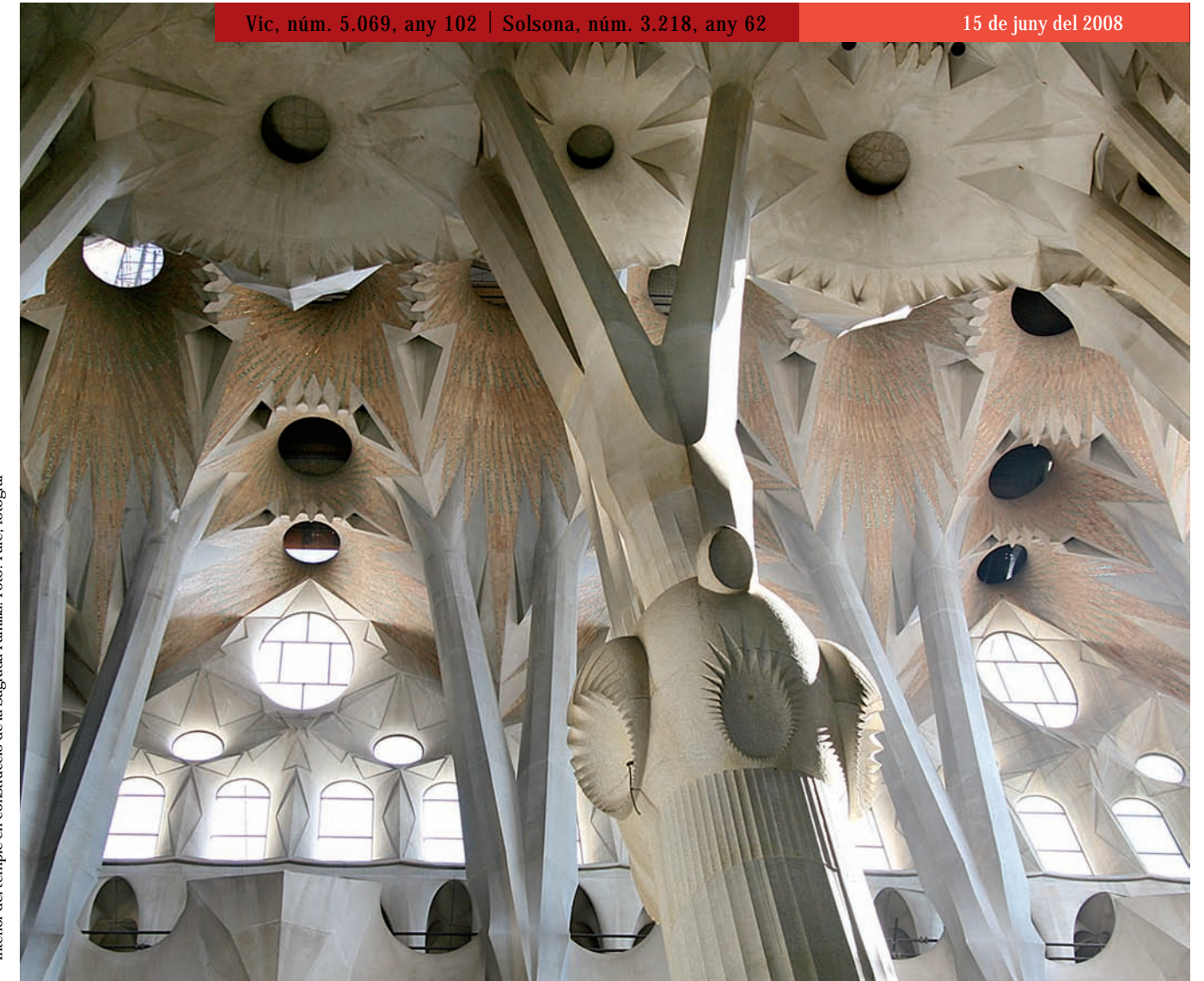
Interior del temple en construcció de la Sagrada Família.

Si dies passats parlàvem de redescobrir el sentit del silenci també cal redescobrir el sentit i l'ús pertinent de la paraula. La paraula autèntica i meditada és un dels mitjans més òptims de comunicació amb els altres i la divinitat. Déu també es manifesta a través de la paraula, una paraula que per la seva autenticitat omple de goig el cor i l'esperit de tots els qui l'escolten amb atenció, l'acullen amb amor i la segueixen amb fidelitat.