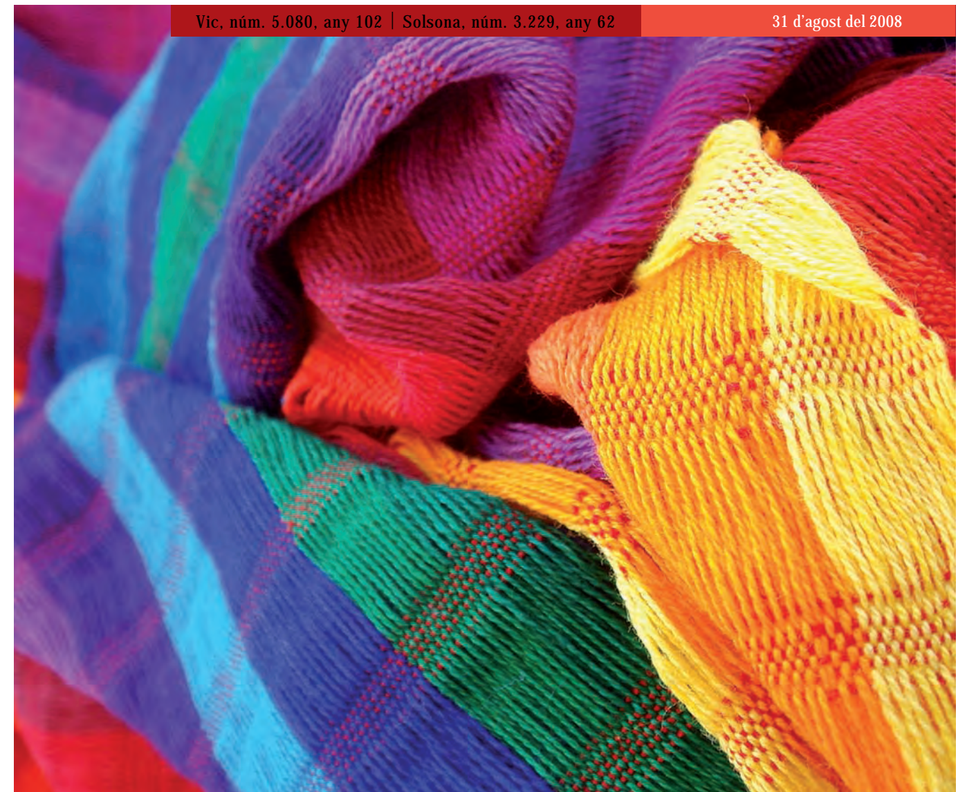
Textures i colors de Guatemala.

Esperem, doncs, que ens reforcem espiritualment per encarar el repte de la crisi, amb les prioritats que correspon.