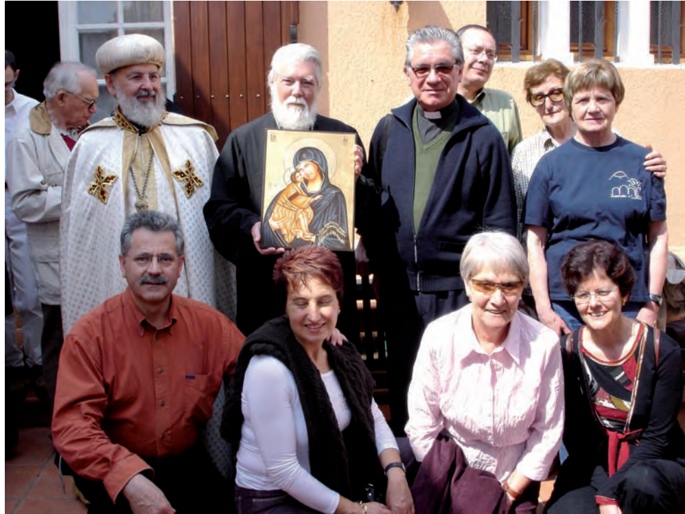
Grup de Vic en la seva visita a l'Ermitage.

Pocs anys després, el 26 de març de 1973, Joan Maria i Eugeni feren la petició formal d'ingressar en la