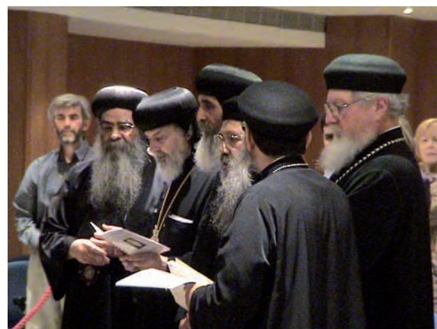
En la cerimònia funerària de comiat a Barcelona

com a coadjutor de la nova diòcesi copta a França, instaurada feia poc. Marsella i Toulon serien el lloc de la nova seu.